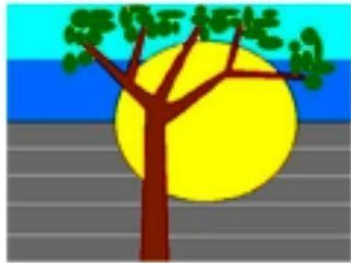
Semillas del Ingenio

4 casas en conjunto abierto Calle 17 con Cra. 83 Cali –Valle Construido en 2004 Ventas del proyecto aprox. 800´000.000 Estado: Totalmente terminado y entregado